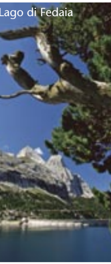
Lago di Fedaja

Il ritmo del camminare, antico e prezioso come l'uomo stesso, ci riporta dentro tempi e silenzi atavici, stabilisce un rapporto più umano con la natura, dentro la natura. Camminare a contatto di usi, costumi e tradizioni, tra sapori e odori unici, attraverso la storia della montagna, delle Alpi, per un approccio diverso e più vicino all'essenza della vita. La Via Alpina è il sentiero dell'uomo, un sentiero fatto di mille altri sentieri, fatto di emozioni e scoperte, di spazi infiniti e realtà specifiche collegati tra loro dalla volontà dell'uomo ma soprattutto dal cuore dell'uomo. Le Dolomiti sorreggono la civiltà delle genti di montagna da millenni, sorreggono in silenzio il nostro progredire, e ci insegnano che nessuna azione, nessun pensiero può prescindere dalla loro grandezza, dalla loro più profonda essenza. La Via Alpina segue questa traccia e descrive un insegnamento perpetuo che noi non dobbiamo far altro che raccogliere e respirare fino in fondo.