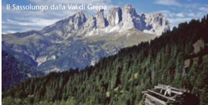
Il Sassolungo dalla Val di Grepà

** Boè: tel. 0462 767208 / albergo.boe@virgilio.it ** Ciamol: tel. 0462 767117 / info@hotelciamol.com ** Contrin: tel. 0462 750506 / albergocontrin@virgilio.it ** Garni Tyrolia: tel. 0462 750343 / garni.tyrolia@tiscali.it * Garni Cesa Walter: tel. 0462 750365 / cesawalter@virgilio.it * Garni Villa Cecilia: tel. 0462 767107 / garni.cecilia@tiscali.it