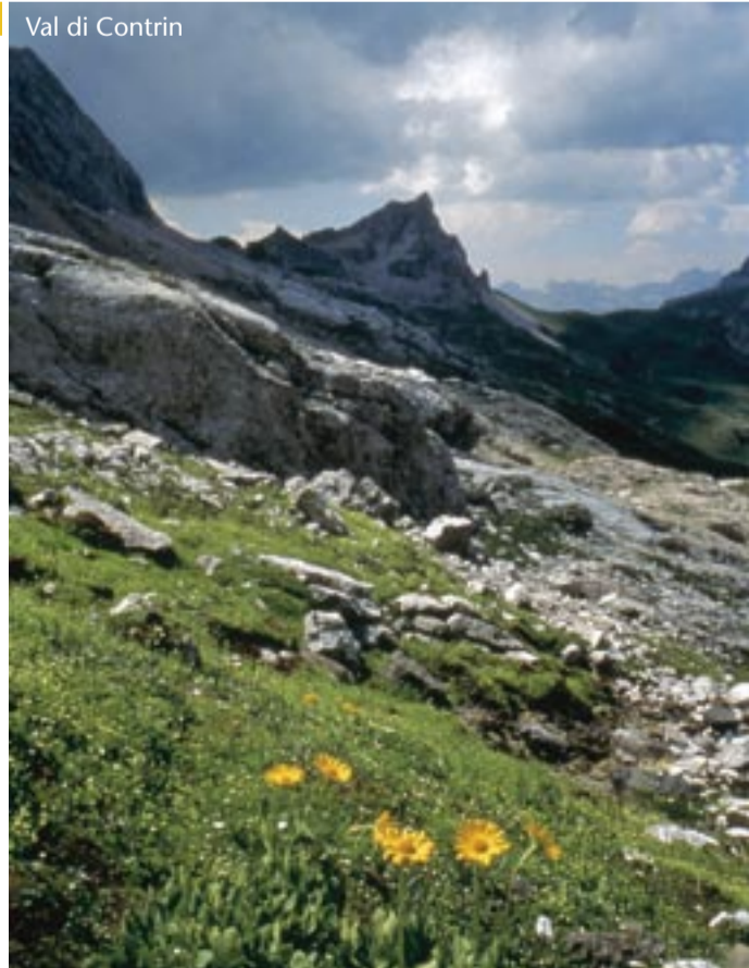
Val di Contrin