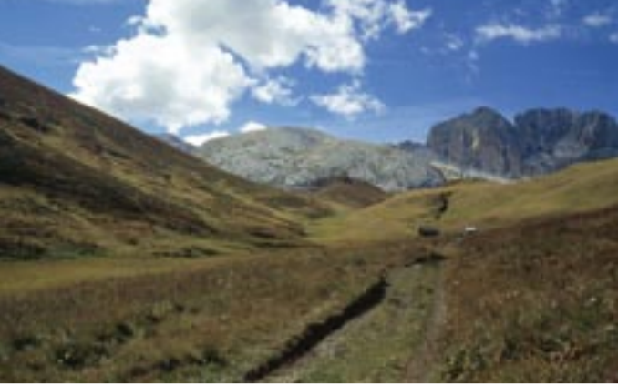
Val di Dona